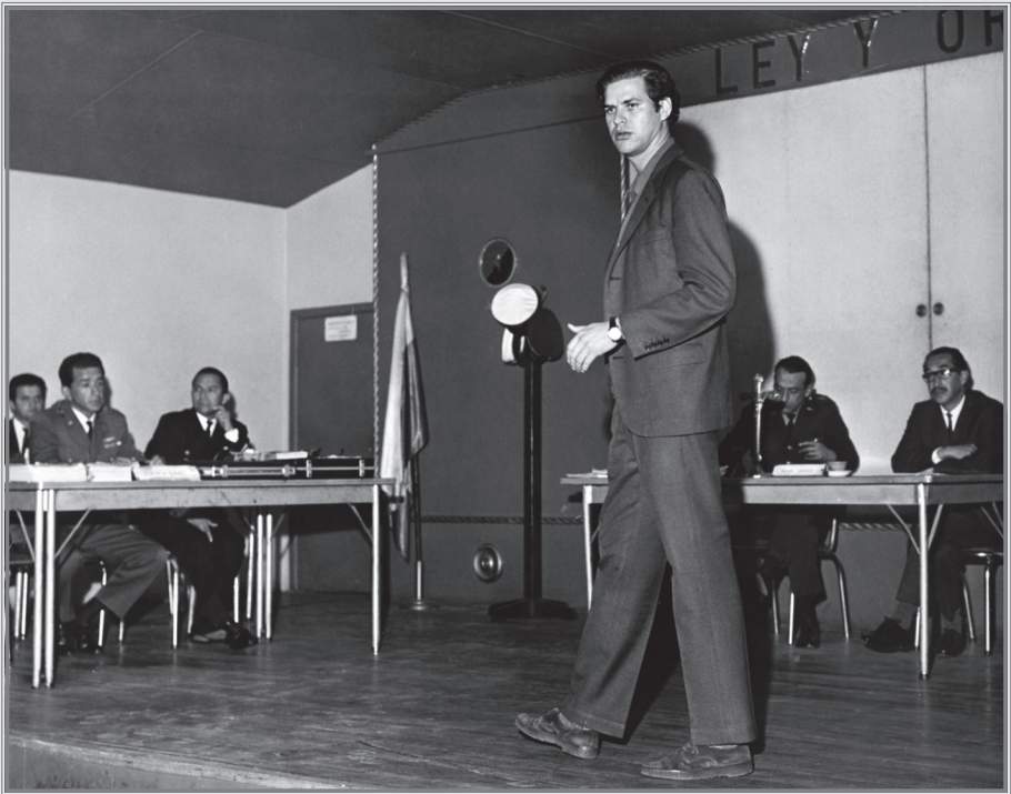
▲ Durante una de las sesiones del Consejo Verbal de Guerra que se le siguió por el delito de rebelión en Bogotá durante 1969, en el cual llevó a cabo su propia defensa.